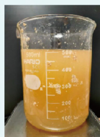
ユニフロック添加前